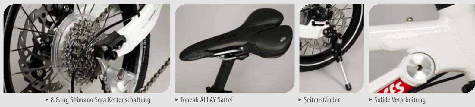
► 8 Gang Shimano Sora Kettenschaltung

Mit dem CARAD wurde das Faltrad geradezu neu erfunden. Das Herzstück dieser innovativen Lösungen ist die Faltmechanik, die es ermöglicht, gleich zwei dieser Falträder in einem kleinen Servicefach zu verstauen.