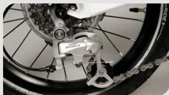
► Präzise arbeitendes Schaltwerk

Zu den besonderen Highlights gehört der optionale Gepäckträger, der auch gefaltet voll einsetzbar bleibt. Mit nur einem Handgriff bringt man das CARAD auf seine Transportmaße von 82 cm Höhe, 78 cm Länge und 26 cm Tiefe.