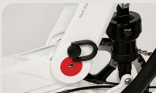
► Klappmechanik und Federung