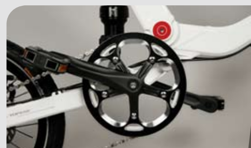
► Kettenblatt mit klappbaren Pedalen