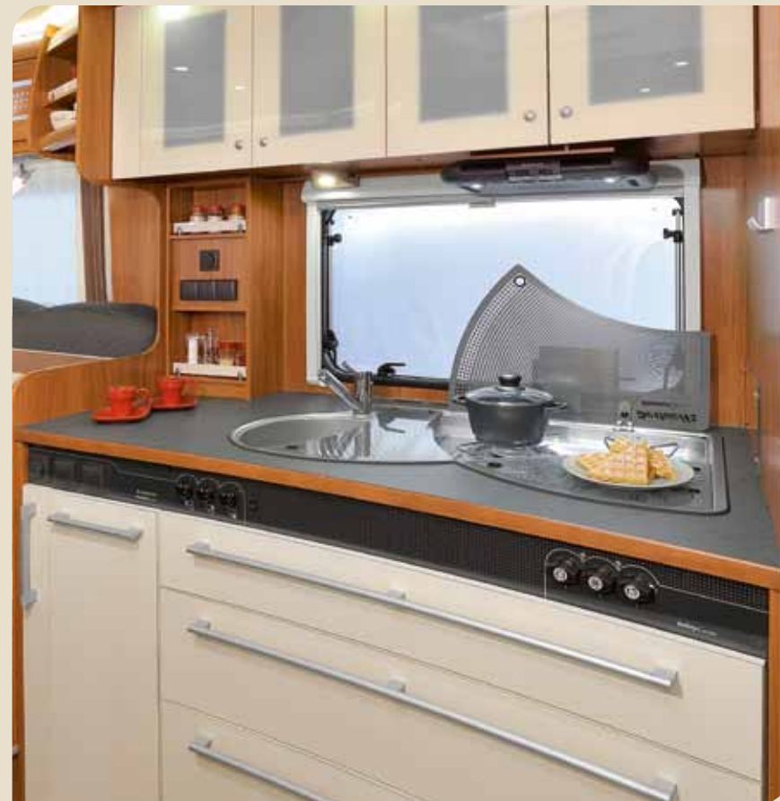
► Elegantes Gourmet-Küchencenter mit geräumigen Schubfächern*