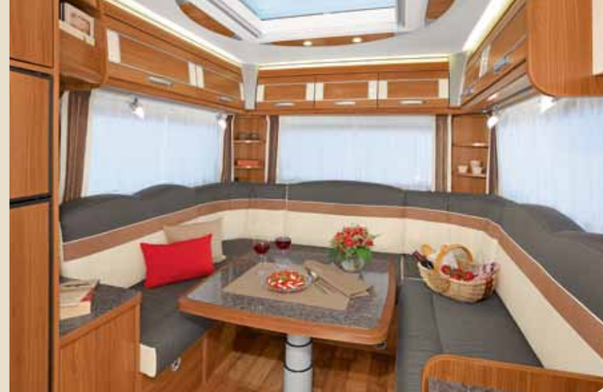
► Traumhaft komfortabel: die große Rundsitzgruppe*

Aber auch sonst bietet der ALPA jede Menge durchdachter Lösungen, die das Reisen zu zweit komfortabel machen. Lernen Sie den neuen ALPA kennen, das ideale Wohnmobil für allein reisende Paare.