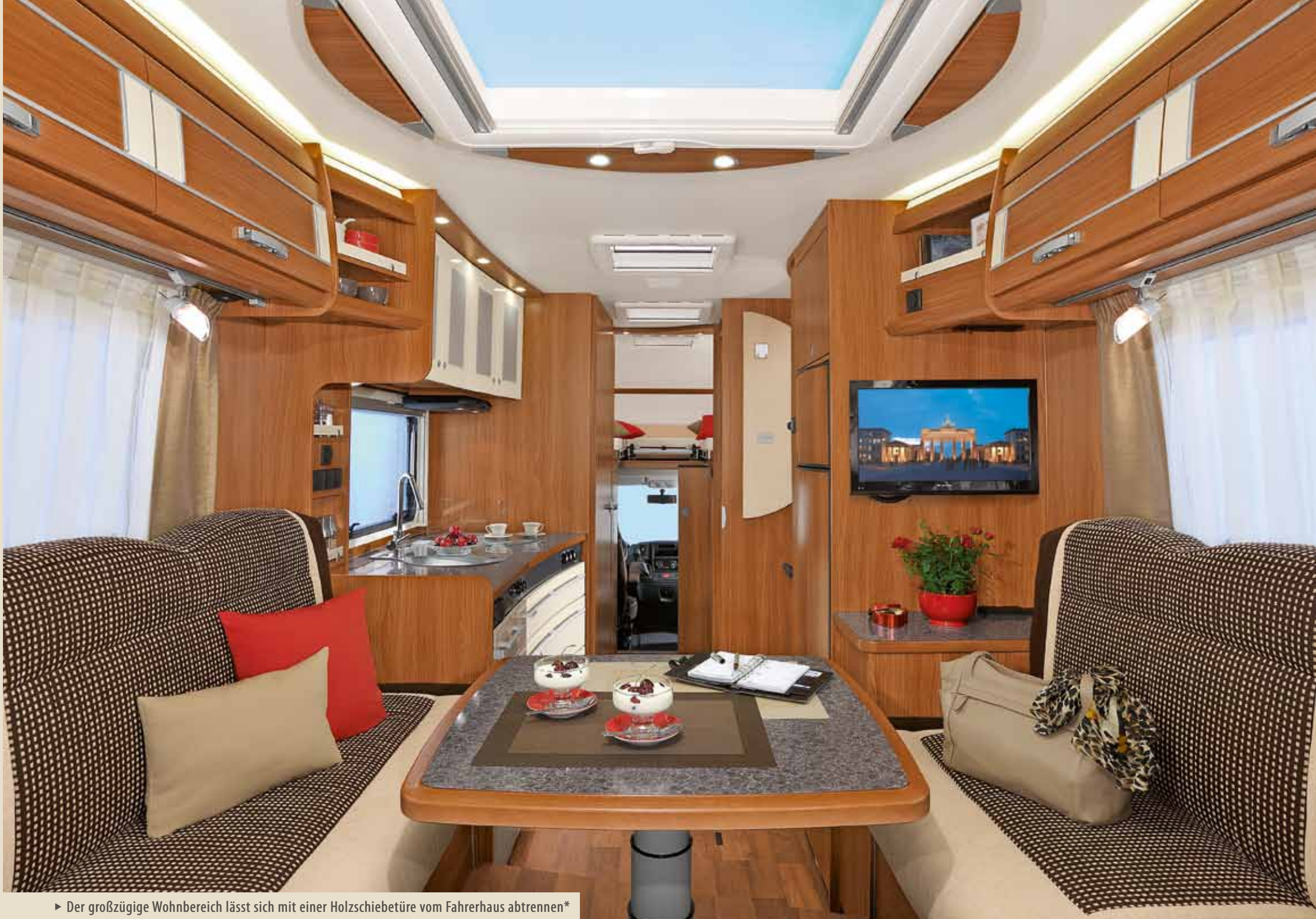
► Der großzügige Wohnbereich lässt sich mit einer Holzschiebetüre vom Fahrerhaus abtrennen*