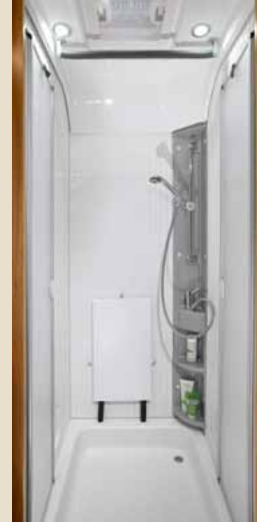
► Großraumbad mit separater Duschkabine*