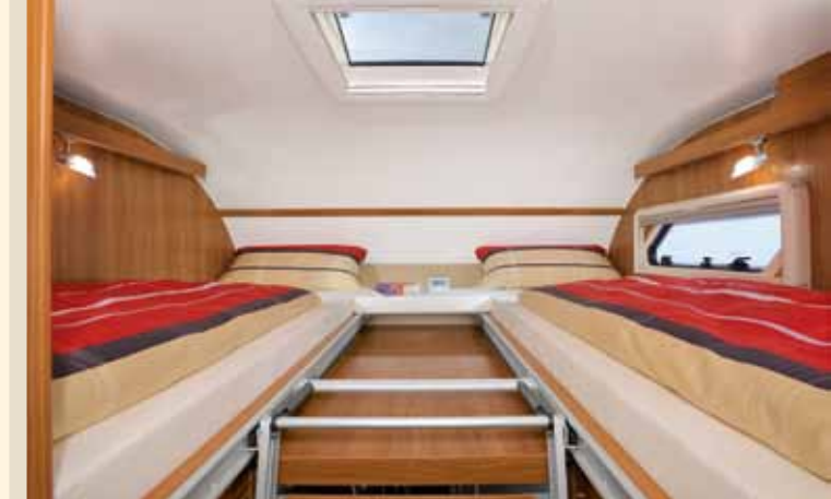
► Einzelbett-Komfort im Alkoven*