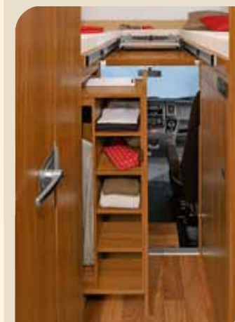
► Ausziehbarer Kleider- u. Wäscheschrank*