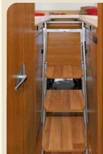
► Große Trittstufen geben Sicherheit*