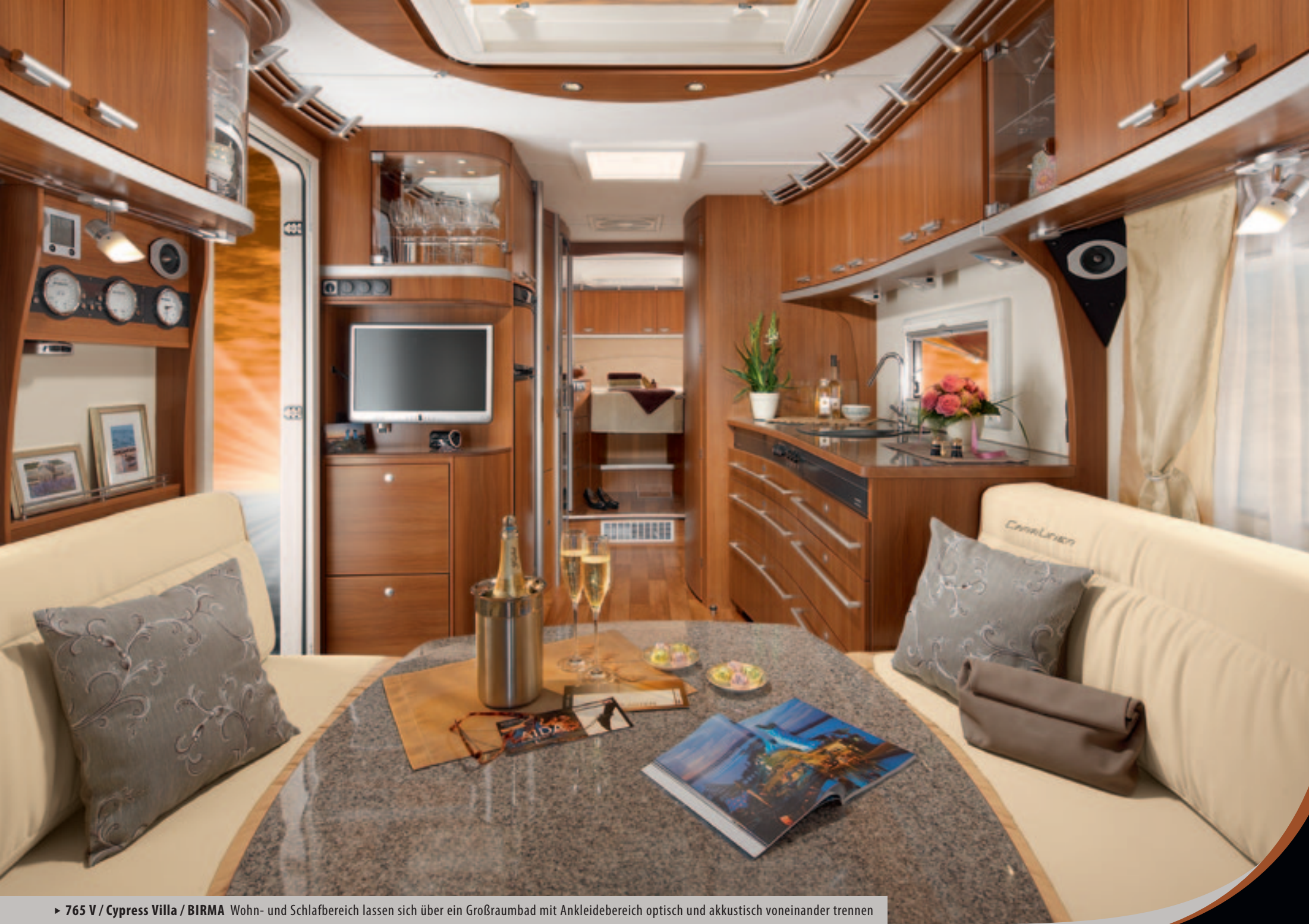
► 765 V / Cypress Villa / BIRMA Wohn- und Schlafbereich lassen sich über ein Großraumbad mit Ankleidebereich optisch und akustisch voneinander trennen