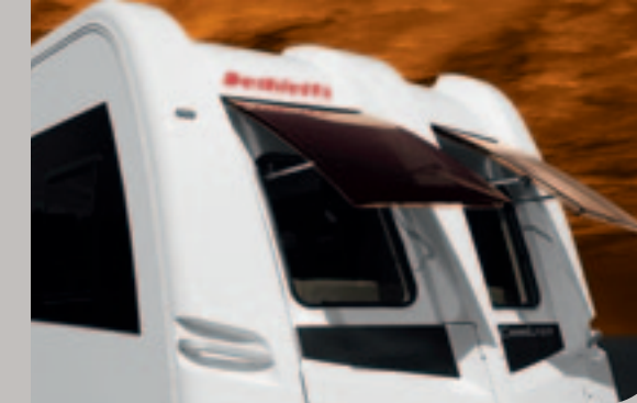
► Zwei ausstellbare Bugfenster