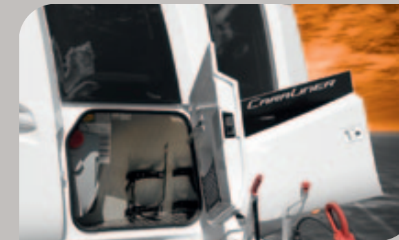
► Gasflaschenkasten mit doppelschaligen Klapptüren