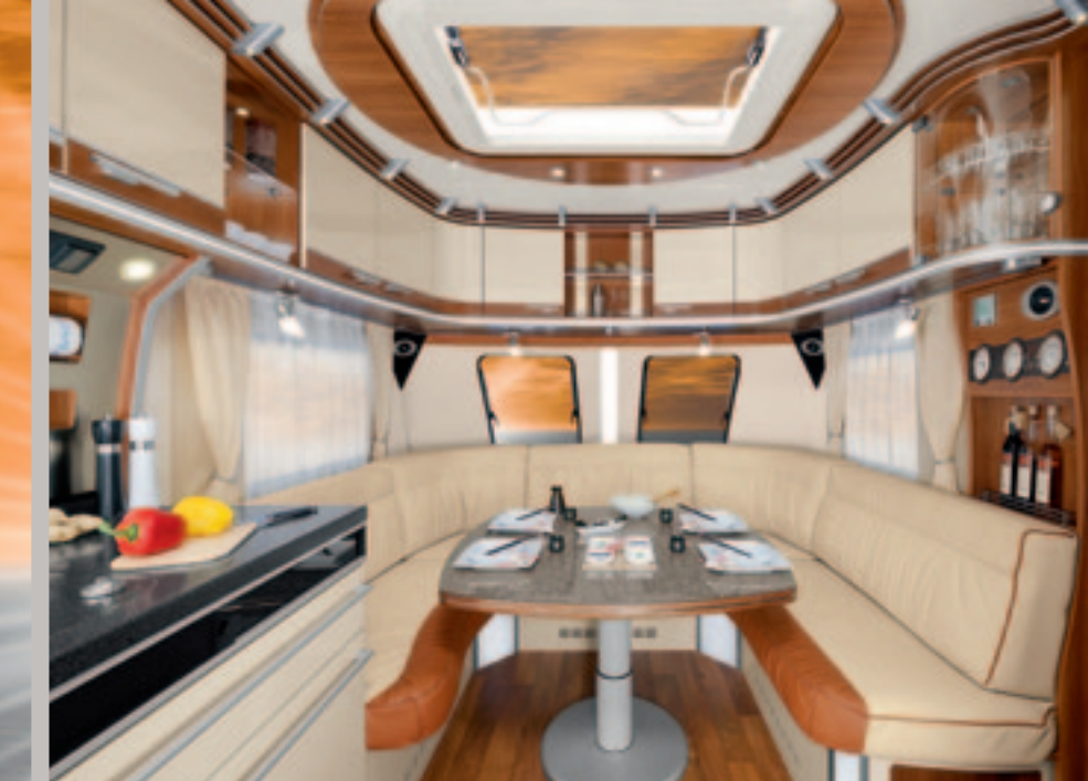
► Das aufwändig konfektionierte Echtlederpolster MURANO (optional) bietet hervorragenden Sitzkomfort