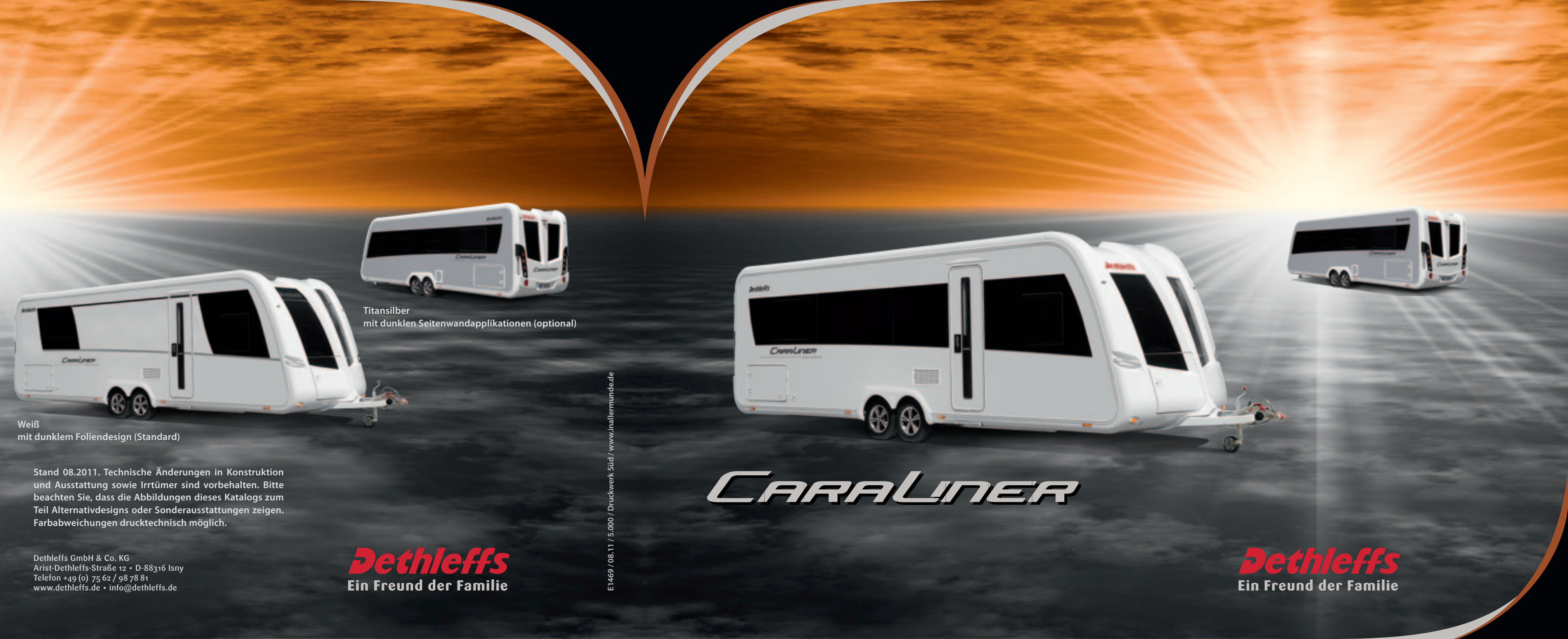
Weiß mit dunklem Foliendesign (Standard)