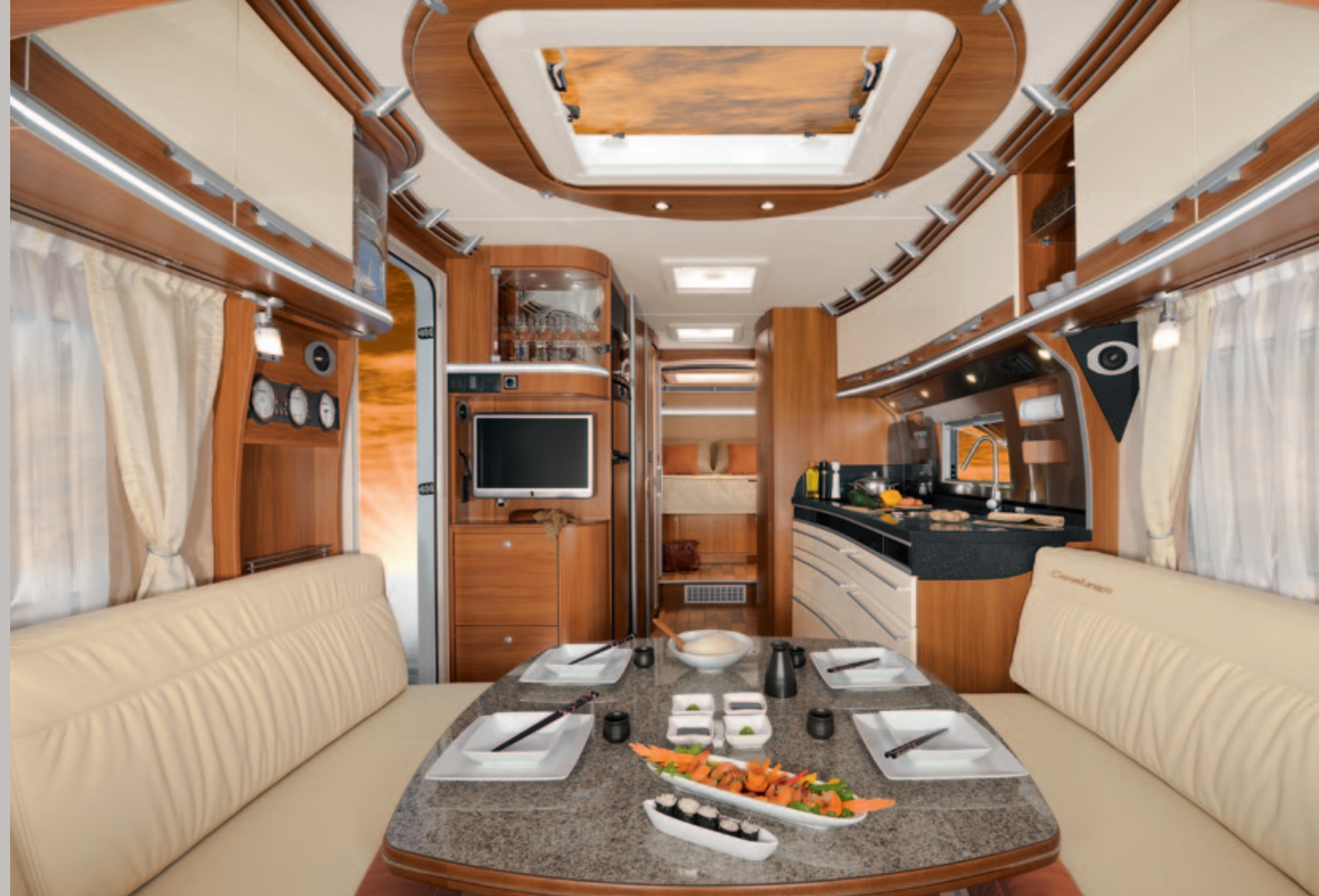
► 765 DBM Fließende Formen und elegante Materialkombinationen prägen das Interieur. Abbildung Möbeloptik Cypress Villa mit cremefarbenen HPL Hochglanzschichtstoff-Fronten und MURANO Echtlederpolster (beides optional)