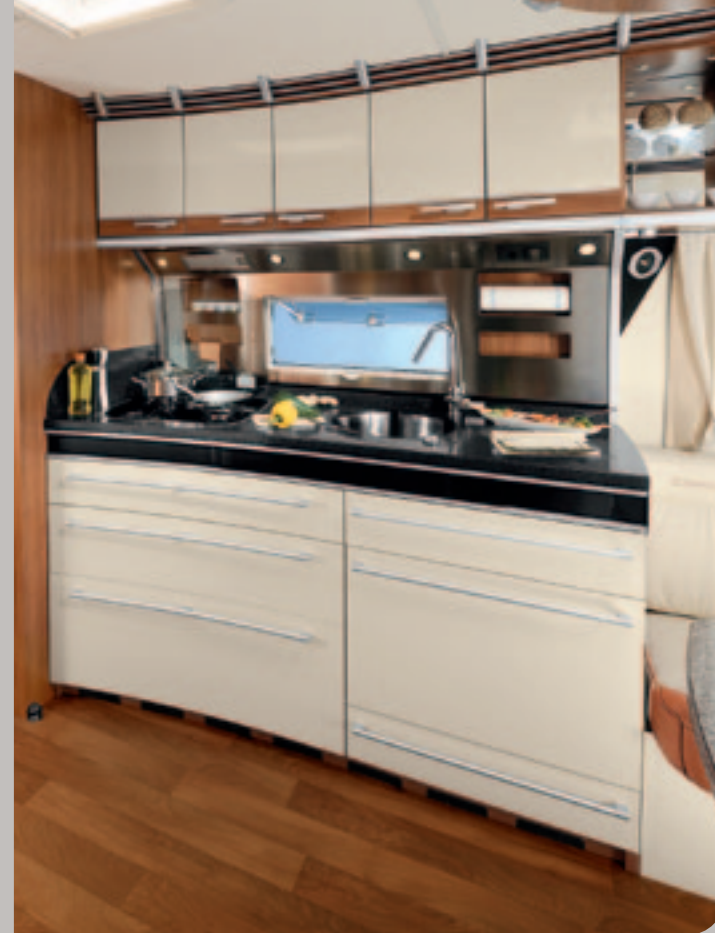
► Luxuriöses Küchencenter (1)

(1) mit HPL Hochglanz-Fronten, Mineralstoff-Arbeitsplatte und Spinflow-3-Flamm-Kocher (optional)