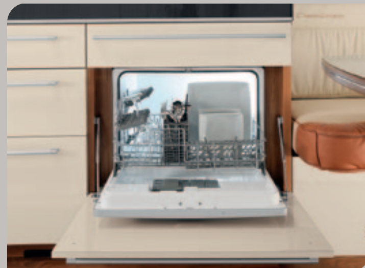
► Kleiner Helfer: Spülmaschine mit nur 7 l Wasserverbrauch pro Spülgang (optional)