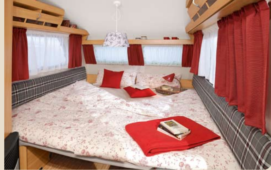
► Die Sitzgruppe lässt sich zur riesigen Liegewiese umbauen.

Serienmäßig dabei: jede Menge nostalgischer Charme!