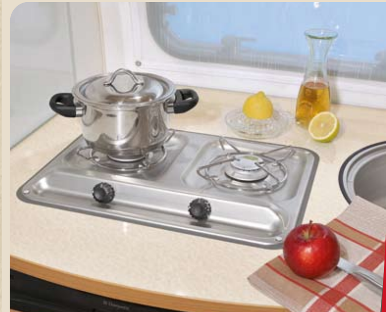
► Aufgesetzter 2-Flammkocher serienmäßig