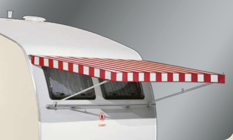
► Fenstermarkise (optional)