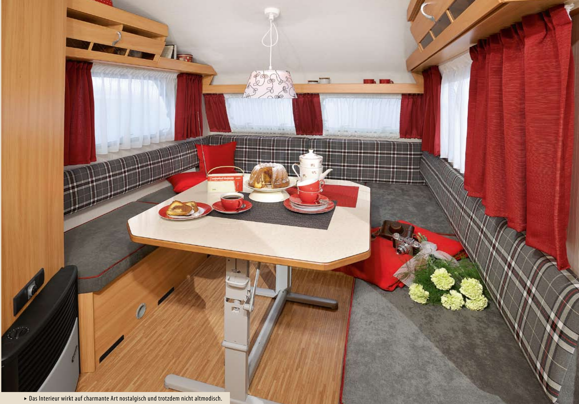
► Das Interieur wirkt auf charmante Art nostalgisch und trotzdem nicht altmodisch.