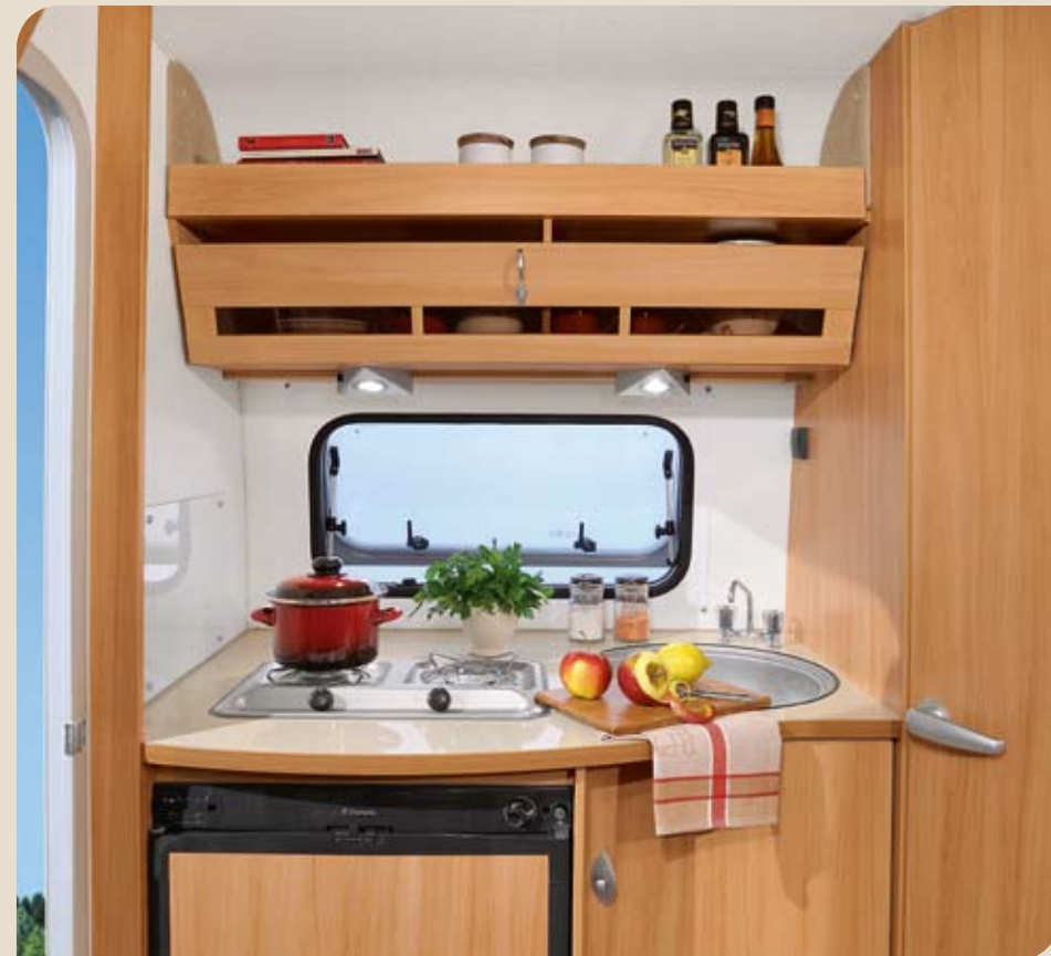
► Funktionelle Küche mit optionalem Kühlschrank