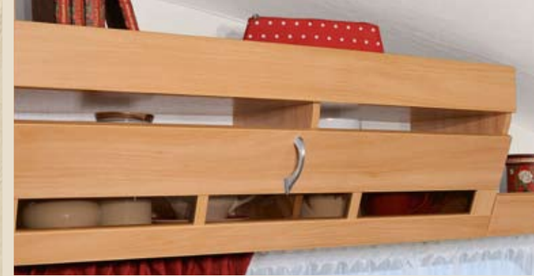
► Dachschränkklappe mit Plexiglas-Inlet und massivem Metallgriff