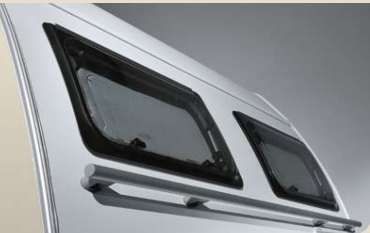
► Serienmäßig: Bug-Ausstellfenster und Alu-Rangierstange