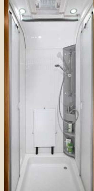
► Großraumbad mit separater Duschkabine*