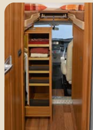
► Ausziehbarer Kleider- und Wäscheschrank*