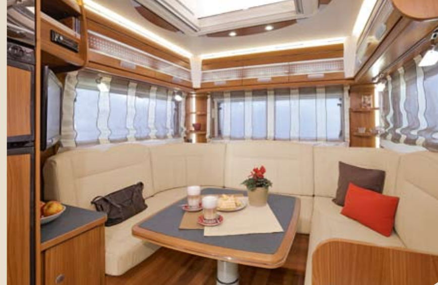
► Traumhaft komfortabel: die große Rundsitzgruppe*

Aber auch sonst bietet der ALPA jede Menge durchdachter Ideen, die das Reisen zu Zweit komfortabel machen. Lernen Sie den neuen ALPA kennen, das ideale Wohnmobil für allein reisende Paare.