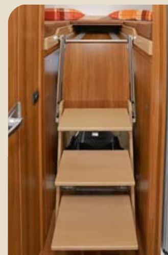
► Große Trittstufen geben Sicherheit*