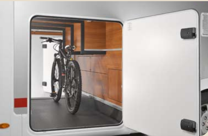
► Große Heckgarage mit viel Platz für alles Sperrige

Bitte beachten Sie, dass die Abbildungen dieses Katalogs zum Teil Alternativdesigns oder Sonderausstattungen zeigen, für die Mehrkosten entstehen. Serien- und Sonderausstattungslisten sind im Internet hinterlegt, Farbabweichungen drucktechnisch möglich.