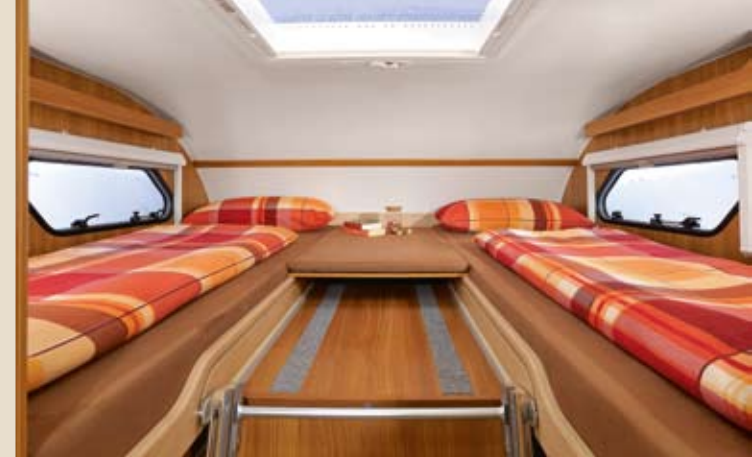
► Einzelbett-Komfort im Alkoven*

* Die Abbildungen in diesem Katalog zeigen das alternative Holzdekor Cypress Villa mit hinterleuchteten Dachschränklappen und die optionale Echtlederausstattung CORTINA. Darüber hinaus sind zum Teil weitere Sonderausstattungen abgebildet, für die Mehrkosten entstehen. Die Serienausstattung ist auf dem separaten ALPA Preisblatt aufgeführt.