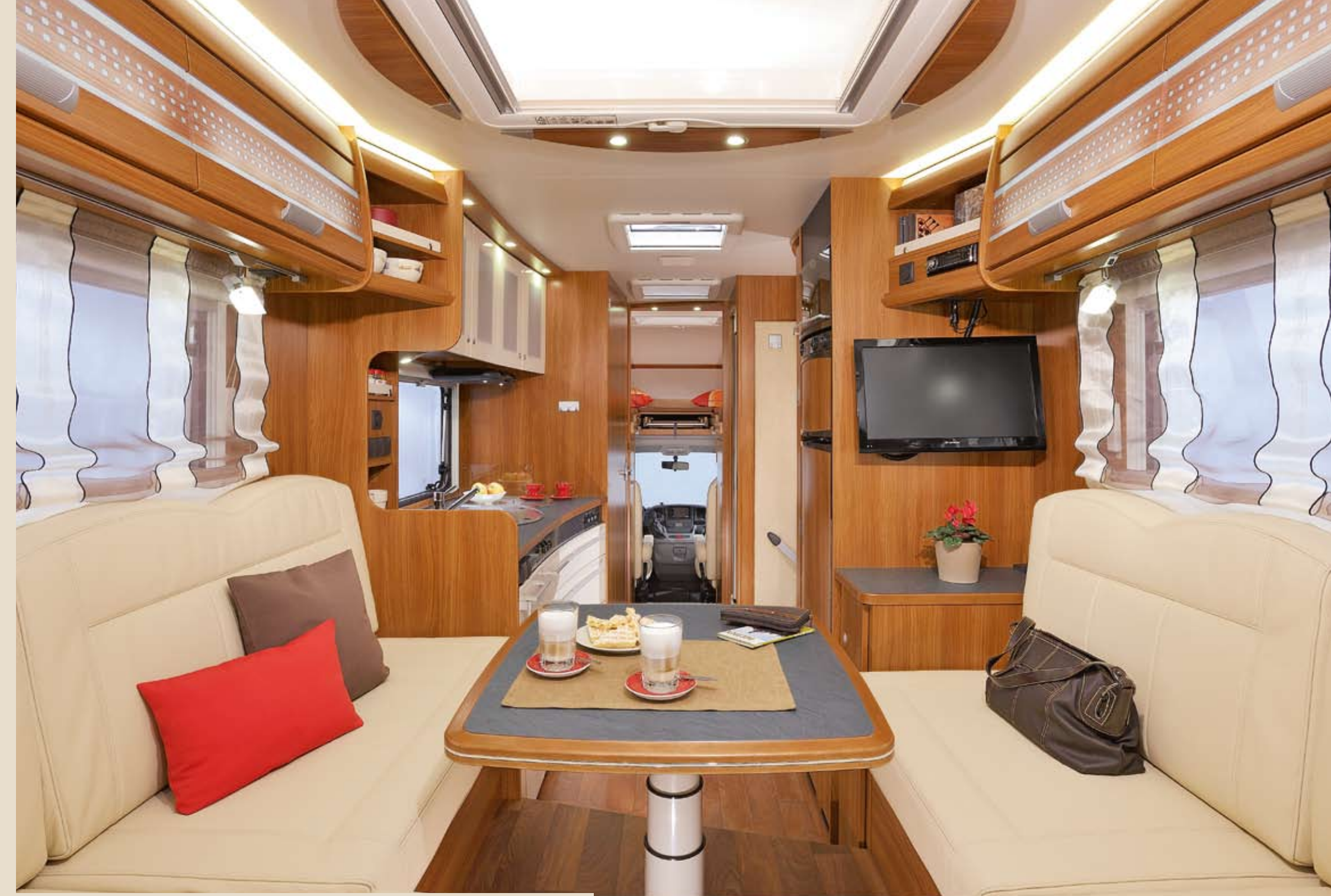
► Der großzügige Wohnbereich lässt sich mit einer Holzschiebetüre vom Fahrerhaus abtrennen.*