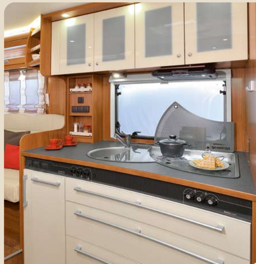
► Elegantes Gourmet-Küchencenter mit voluminösen Schubfächern*