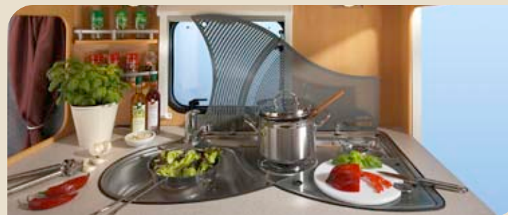
▶ Gourmet-Küchencenter aus dem Frauenmobil-Projekt