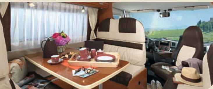
▶ ESPRIT I 7870 / BOSTON

Diese Aktion endet am 31.03.2009. Alle teilnehmenden Händler können Sie unter www.dethleffs.de oder telefonisch unter 07562/987 881 in Erfahrung bringen.