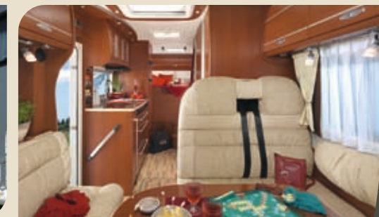
▶ ESPRIT H 6870